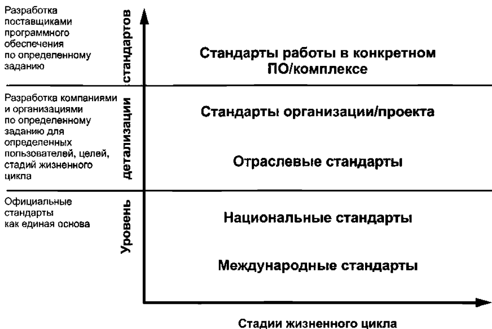
Рисунок 1 — Сферы применения стандарта информационного моделирования