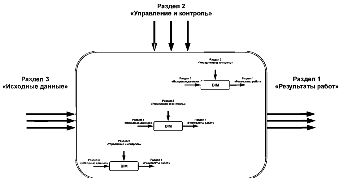
Рисунок 3 — Взаимодействие между BIM-подпроцессами

Содержание раздела можно получить из руководства по доставке информации, определяющего требования к представлению результатов работ и обмену данными, а также из других документов, определяющих структуру и содержание желаемых результатов.